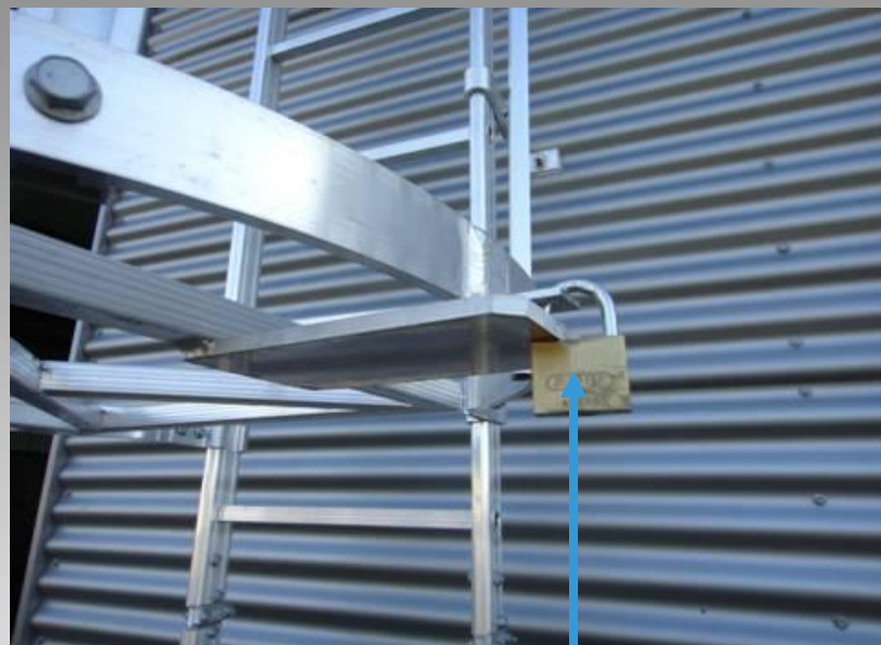
Dispositif de condamnation d'accès